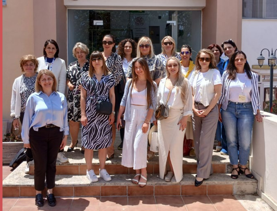
Αναμνηστική φωτογραφία από την Εβδομάδα επιμόρφωσης προσωπικού Erasmus + στην Πανεπιστημιούπολη του Γάλλου

Με επιτυχία ολοκληρώθηκε το πρόγραμμα επιμόρφωσης προσωπικού με θέμα «Διεθνοποίηση, συμπερίληψη, διαφορετικότητα, βιώσιμη ανάπτυξη», το οποίο οργανώθηκε από το Τμήμα Διεθνών Σχέσεων του Πανεπιστημίου Κρήτης. Στελέχη διοικητικών υπηρεσιών Ανώτατων Εκπαιδευτικών Ιδρυμάτων από τη Λιθουανία , την Ιταλία , την Κροατία και την Πολωνία συμμετείχαν με σκοπό την επιμόρφωση και τον γόνιμο διάλογο στη διαχείριση ζητημάτων, όπως η προώθηση της απασχολησιμότητας, η κοινωνική ένταξη, η συμμετοχή στα κοινά, η καινοτομία, η περιβαλλοντική βιωσιμότητα εντός και εκτός Ευρώπης και γενικότερα η προώθηση της εξωστρέφειας και η διεθνοποίηση του Πανεπιστημίου Κρήτης.