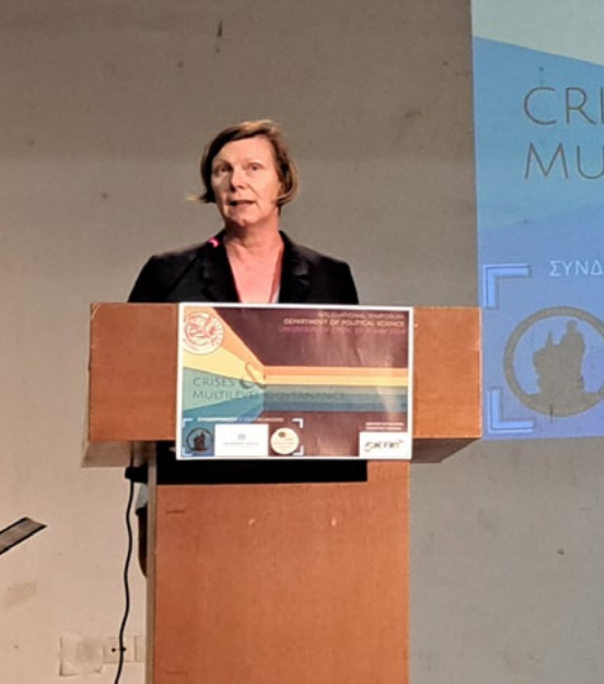
Στιγμιότυπο από την κεντρική ομιλία της Πρυτάνεως του Science Po Grenoble Καθηγήτριας Sabine Saurugger

πολιτικών τόσο σε εθνικό όσο και σε τοπικό επίπεδο ενώ παρουσιάστηκαν και ερευνητικά πορίσματα σε σχέση με τον ρόλο και τις δυνατότητες που έχει η γραφειοκρατία πρώτης γραμμής (street-level bureaucracy) να προσαρμόζει την υλοποίηση δημόσιων πολιτικών στο εκάστοτε περιβάλλον εφαρμογής τους.