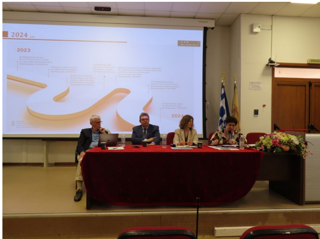
Στιγμιότυπο από τη διεξαγωγή του Επιστημονικού Συνεδρίου με τίτλο «Οι Κοινωνικές και Ανθρωπιστικές Επιστήμες στον 21ο αιώνα»