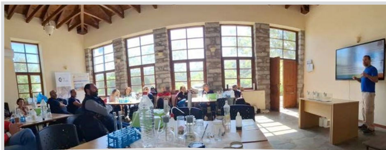
Επιμορφωτική επίσκεψη των καθηγητών στον Κόμβο – Σχολείο στο Νοφαλιό Λασιθίου

Πέραν του ερευνητικού έργου, ο σταθμός, το Πανεπιστήμιο Κρήτης και το ΕΠΕΧΗΔΙ, πρωτοπορούν και στις εκπαιδευτικές δράσεις για την επιμόρφωση της νέας γενιάς σε θέματα σχετικά με την κλιματική αλλαγή. Στο πλαίσιο του έργου EDU4Clima , που χρηματοδοτήθηκε από το Ελληνικό Ίδρυμα Έρευνας και Καινοτομίας, εγκαθιδρύθηκε Κόμβος Έρευνας, Καινοτομίας και Διάχυσης στο Φινοκαλιό ως χώρος διαλόγου για την κλιματική αλλαγή, την αέρια ρύπανση, τη βιώσιμη ανάπτυξη και τα σύγχρονα περιβαλλοντικά ζητήματα. Ο Κόμβος στεγάστηκε στο παλιό δημοτικό σχολείο στο Νοφαλιό, που απέχει έξι χιλιόμετρα από το Φινοκαλιό.