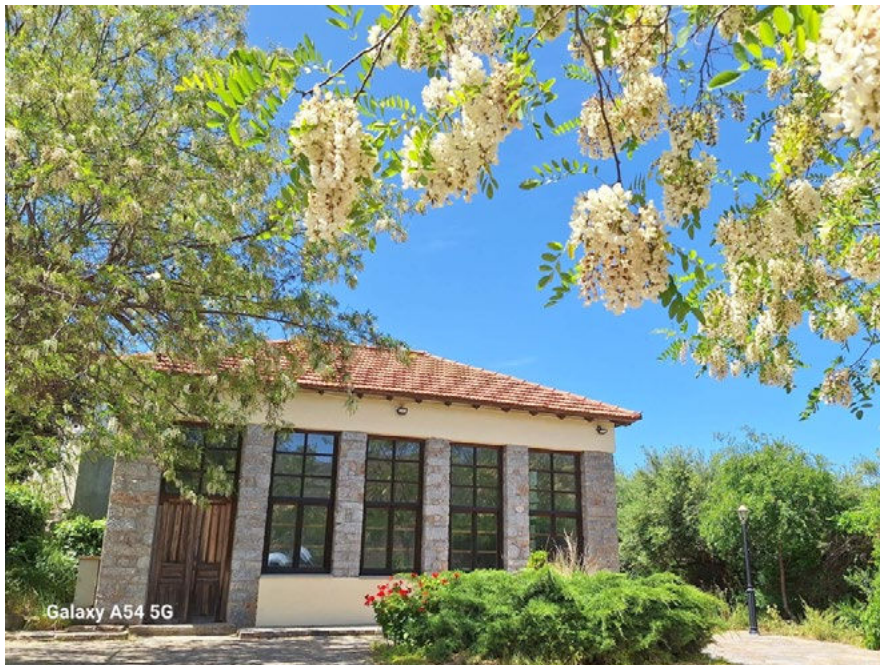
Το σχολείο στο χωριό Νοφαλιά Λασιθίου

Ο Κόμβος στο Φινοκαλιά έχει πλέον και διεθνή αντίκτυπο, καθώς αποτελεί ένα από τους βασικούς Κόμβους όπου πραγματοποιείται επιμόρφωση εκπαιδευτικών σχετικά με την κλιματική αλλαγή στην Ευρώπη. Το έργο CLIMADEMY (Climate change teachers' Academy), που χρηματοδοτείται από το πρόγραμμα Erasmus+ και στο οποίο το Πανεπιστήμιο Κρήτης είναι συντονιστής φορέας, αποτελεί την ευρωπαϊκή ακαδημία εκπαιδευτικών για την κλιματική αλλαγή και έχει Κόμβους σε τέσσερις συνολικά χώρες (Ελλάδα, Γερμανία, Ιταλία, Φινλανδία). Το δίκτυο του έργου φέρνει κοντά τους ερευνητές με τους εκπαιδευτικούς, ώστε να μεταφερθεί αυτούσιο και επίκαιρο το μήνυμα των αλλαγών που συντελούνται στο φυσικό περιβάλλον και της αναγκαιότητας για δράση. Σε συνεργασία με το Εργαστήριο Διδακτικής των Θετικών Επιστημών του Παιδαγωγικού Τμήματος Δημοτικής Εκπαίδευσης του Πανεπιστημίου Κρήτης, η πληροφορία μετασχηματίζεται σε εκπαιδευτικό υλικό ώστε να μπορούν οι εκπαιδευτικοί με τη σειρά τους να διδάξουν την κλιματική αλλαγή στις τάξεις τους. Μέχρι στιγμής έχουν συμμετάσχει 38 Έλληνες εκπαιδευτικοί στις επιμορφώσεις, οι οποίες θα συνεχιστούν με αυξανόμενη ένταση το σχολικό έτος 2024-25.