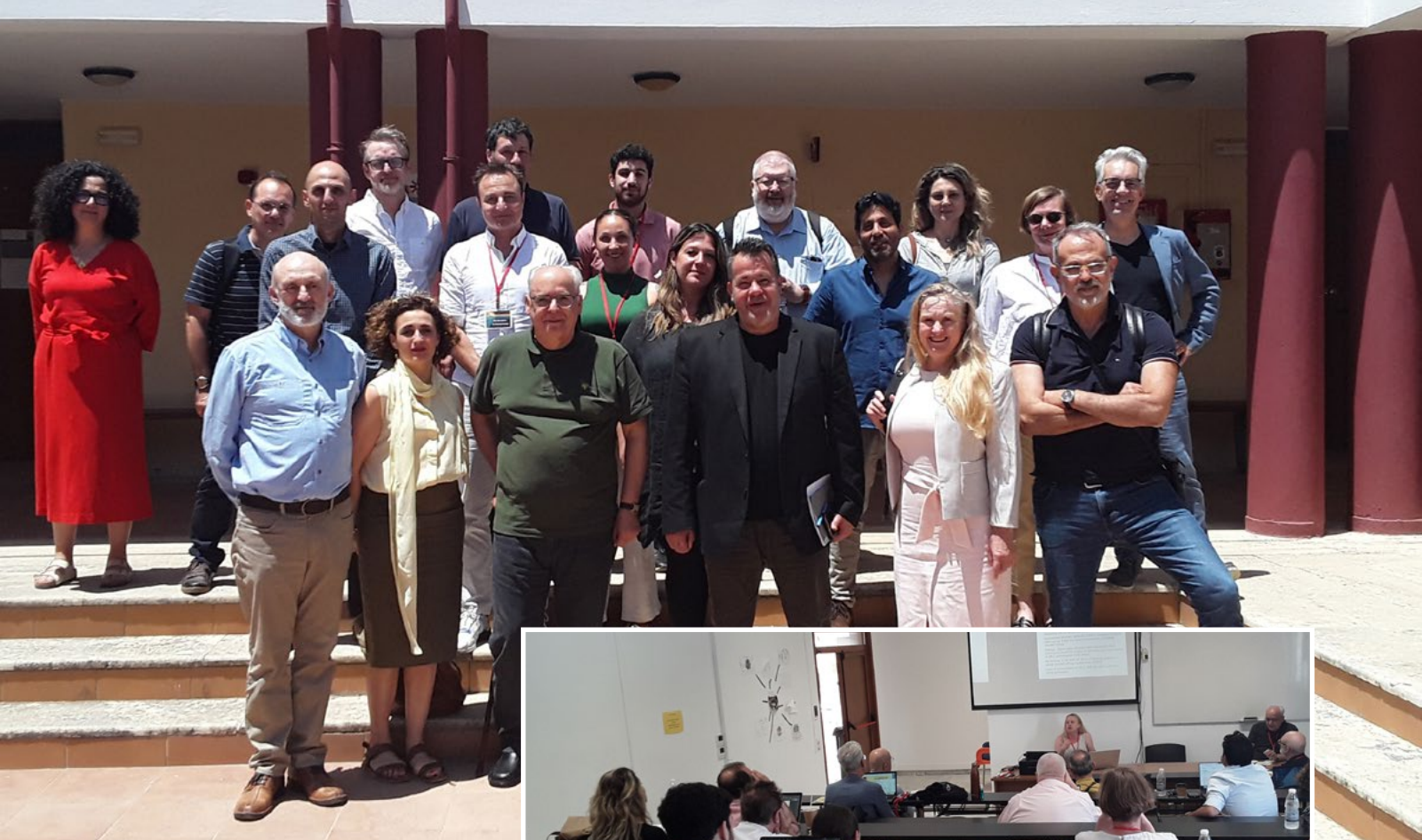
Αναμνηστική φωτογραφία από το Διεθνές Συμπόσιο «Κρίσεις και Πολυεπίπεδη Διακυβέρνηση»