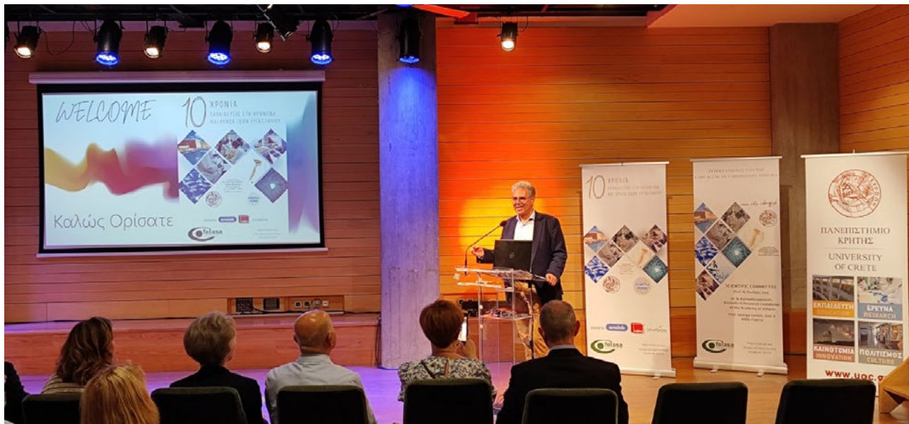
Στιγμιότυπο από την ομιλία του Αντιπρύτανη Έρευνας και Ανάπτυξης του Πανεπιστημίου Κρήτης, Καθηγητή Μιχαήλ Παυλίδη στην Επετειακή Εκδήλωση για τα 10 Χρόνια Εκπαίδευσης στη Χρήση Ζώων Εργαστηρίου

Το Τμήμα Βιολογίας του Πανεπιστημίου Κρήτης, σε συνεργασία με το Ινστιτούτο Μοριακής Βιολογίας και Βιοτεχνολογίας του Ιδρύματος Έρευνας και Τεχνολογίας, διοργάνωσε τιμητική εκδήλωση, την Παρασκευή 31 Μαΐου 2024, για τα 10 χρόνια επιτυχημένης λειτουργίας του θερινού σχολείου για τη φροντίδα και χρήση ζώων εργαστηρίου . Η εκδήλωση πραγματοποιήθηκε στην αίθουσα του Πειραματικού Θεάτρου του Πολιτιστικού Κέντρου του Δήμου Ηρακλείου.